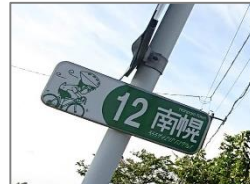
そらちゲートエリアサイン